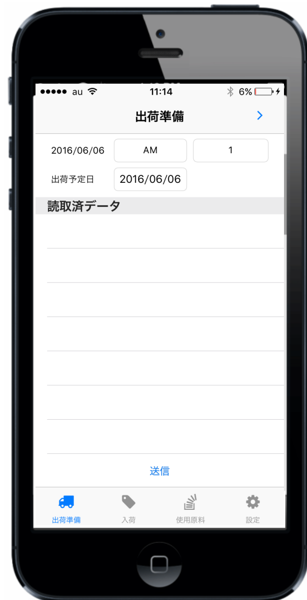
Fig. スマートフォンイメージ